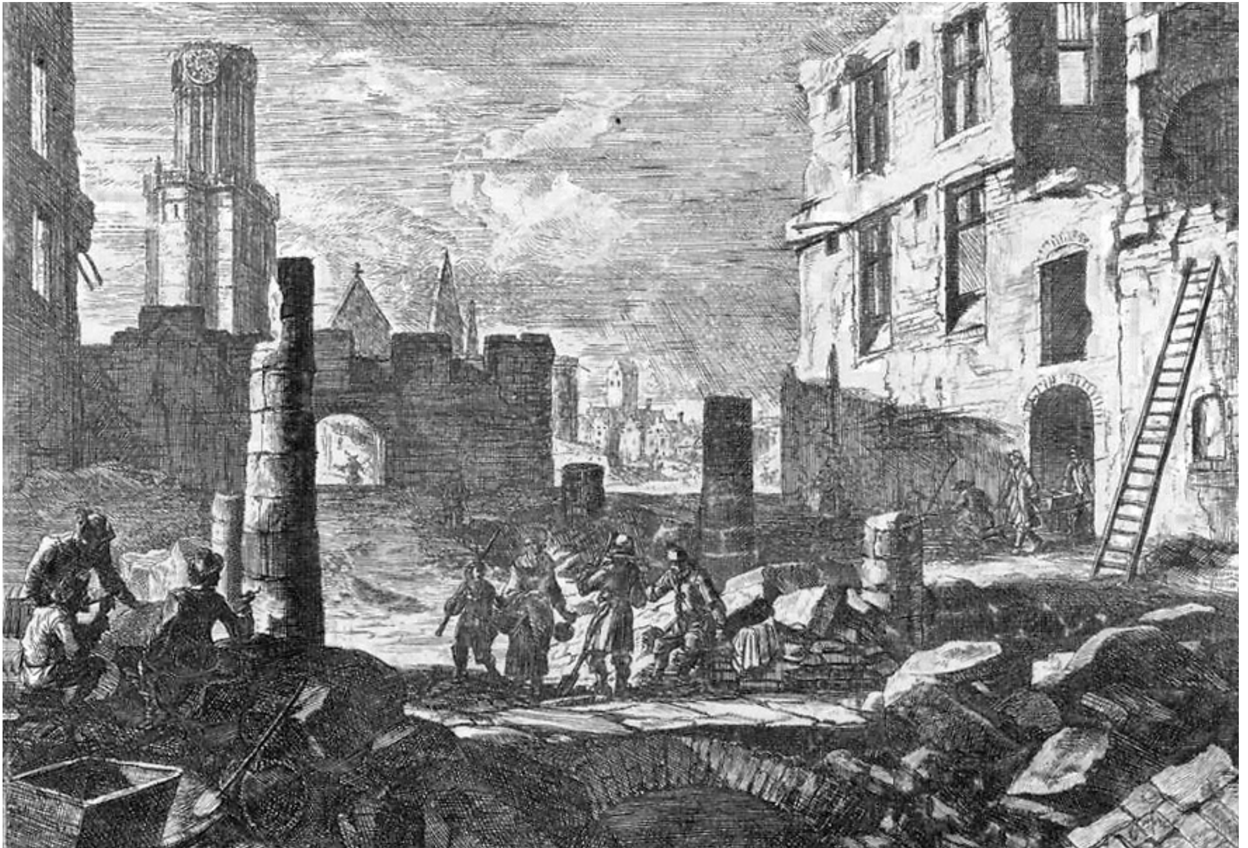
Furor Francorum: in 1695 werd Brussel grondig verwoest door Franse troepen