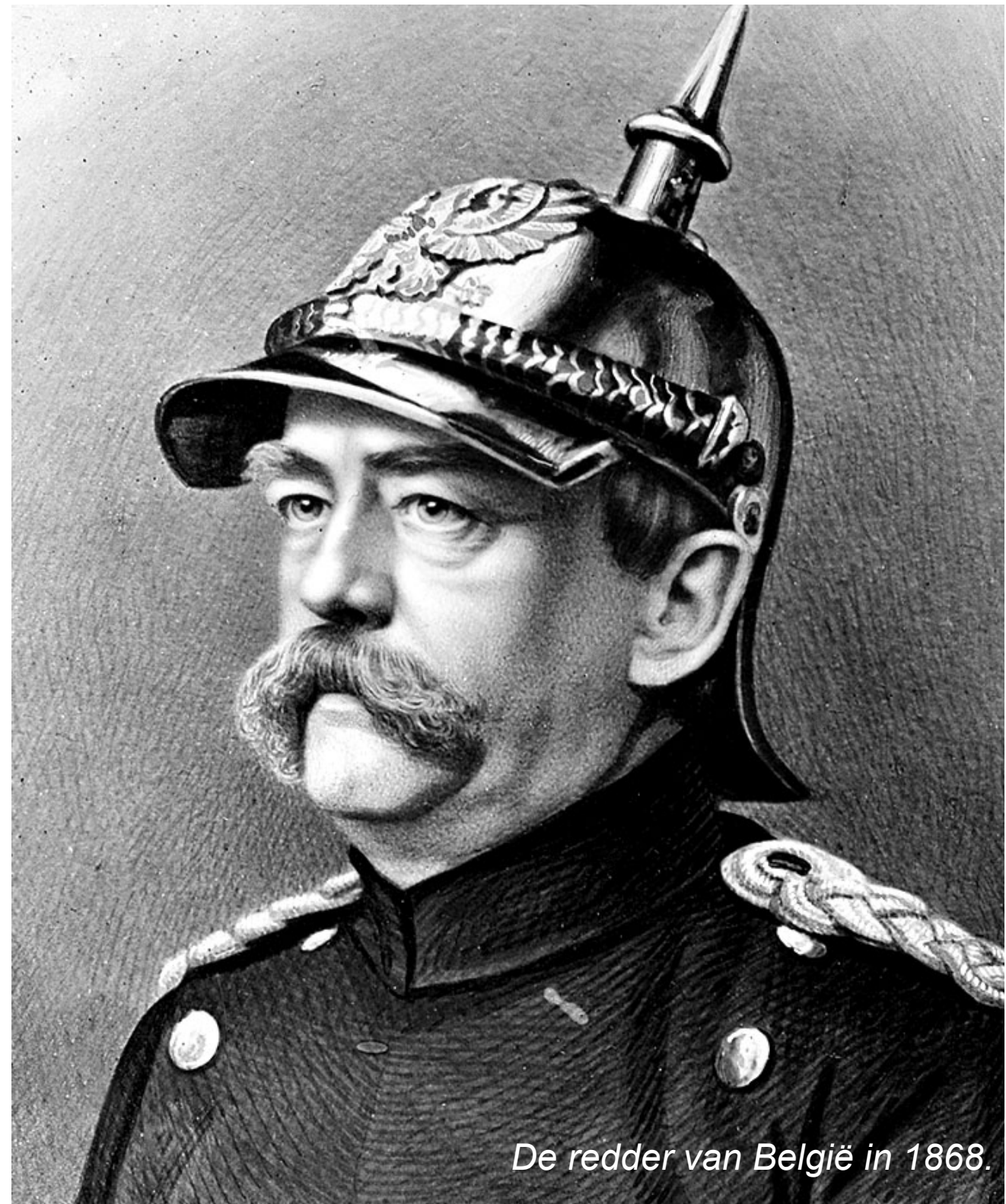
De redder van België in 1868.

Maar vooral zou het nooit "DEN GROOTEN OORLOG" zijn geworden, want allemaal beperkt tot enkele weken sabelgekletter op Franse bodem, GEEN WERELDOORLOG dus met scheepsladingen vol multikultureel kanonnenvlees uit de Britse en Franse koloniën en uit de USA ter wille van de misplaatste trots van een 'Belgische' ridder-koning en waarbij er zo'n tien miljoen piotten mekaar het vilbeluik indreven.